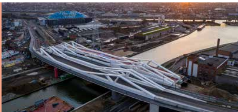
9 meter en 10 centimeter

Hoe hoog is de nieuwe Burgemeester Gabriel Theunisbrug aan het Sportpaleis?