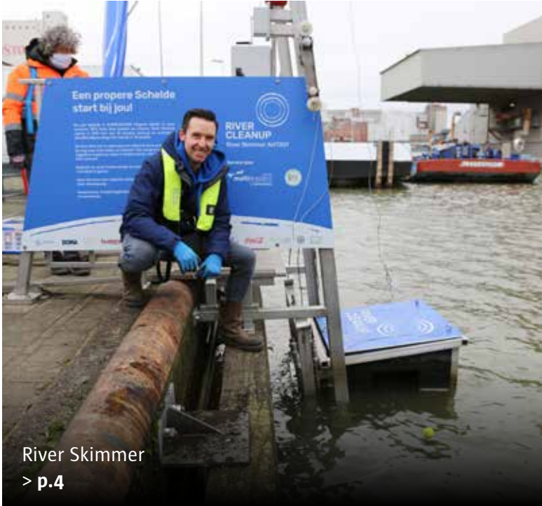
River Skimmer > p.4