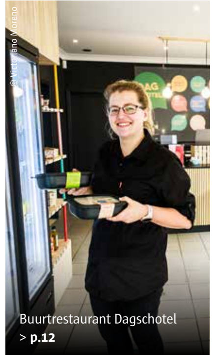
Buurtrestaurant Dagschotel > p.12