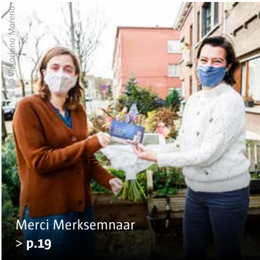
Merci Merksemnaar > p.19