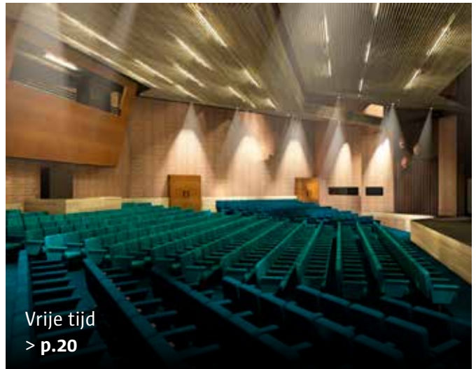
Vrije tijd > p.20