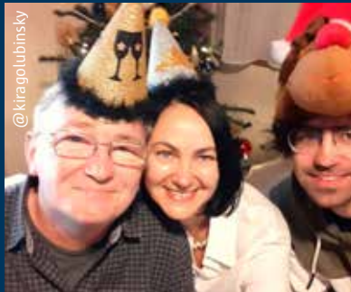
@ kirago lubins ky

Hondje Loki keek vanop een bankje aan het Melgeshof uit naar het nieuwe jaar.